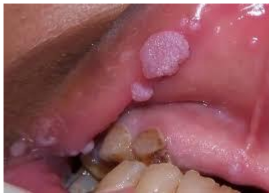
Hình ảnh sùi mào gà ở chân

Trên thực tế, sùi mào gà là loại bệnh chỉ hình thành vùng niêm mạc, bán niêm mạc. rất nhiều người cảm thấy rằng sùi mào gà mọc tại chân tay. song, một số mụn dạng hao hao như sùi mào gà tại chân tay đó không có là bệnh mà đây là một dạng khác. Nó là mụn cộc, cũng chung loại virút HPV, tuy nhiên lại không